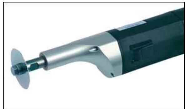
MST-Instrumente GmbH – Hersteller von Gipsägen, Autopsiesägen und Pferdezahnraspeln

Für die Erstellung der Risikomanagementakte kam im Unternehmen bereits seit 2005 der Risk Manager zum Einsatz. Da bekannt war, dass die Lösung über Erweiterungsmodule verfügt, wie zum Beispiel für medizinisch elektrische Geräte, entschlossen sich die Brüder zunächst die Vollversion des Risk Manager zu evaluieren. Somit sollten alle für sie relevanten Anforderungen bzw. Normen in einem System übersichtlich und zeitsparend abgedeckt werden. Während der Testphase konnten sich